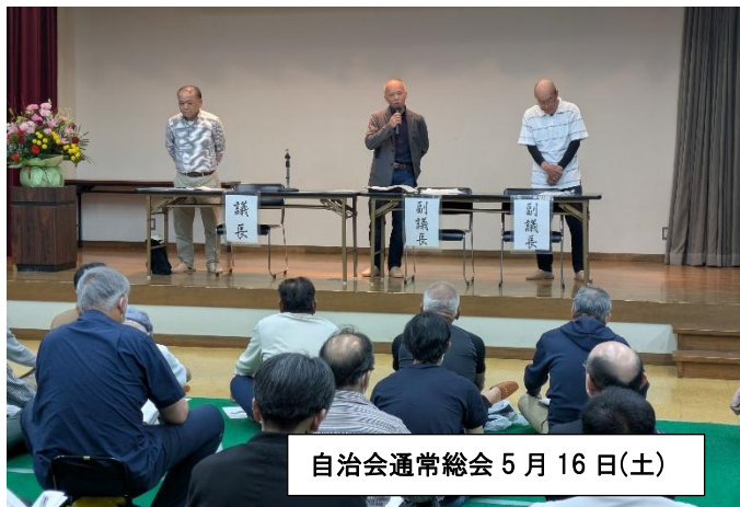
自治会通常総会 5月16日(土)