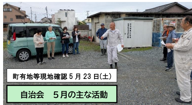
町有地等現地確認 5月23日(土)