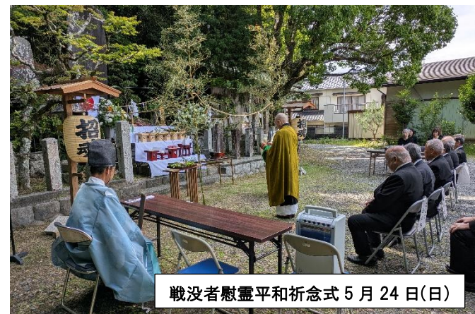
戦没者慰霊平和祈念式 5月24日(日)