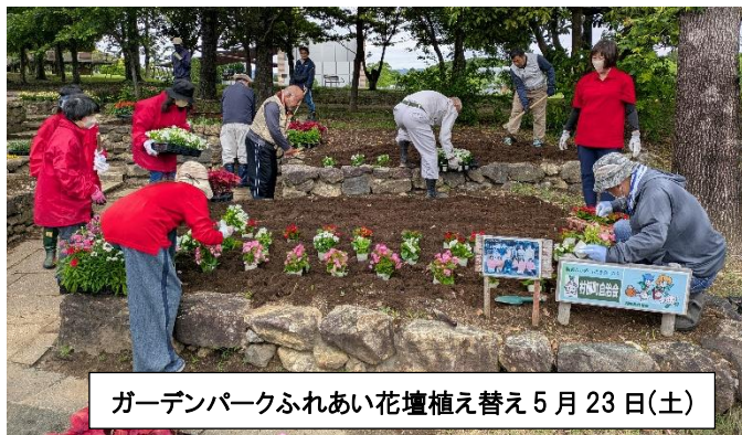
ガーデンパークふれあい花壇植え替え 5月23日(土)