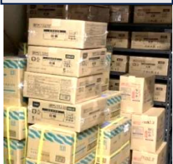
倉庫内備蓄品の様子