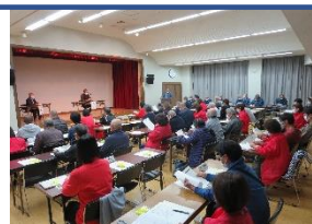
11月26日（土） 第3回組長会