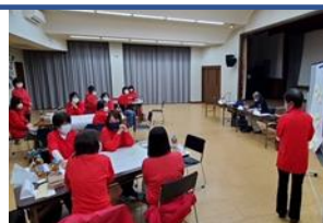
11月12日（土） 女性部座談会