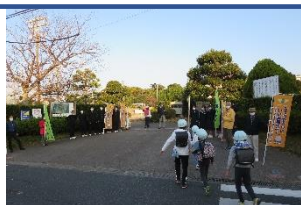
11月11日（金） ひとりひとりにいい声掛けデー