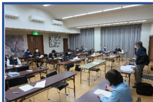
11月5日（土） 会館利用団体との懇話会