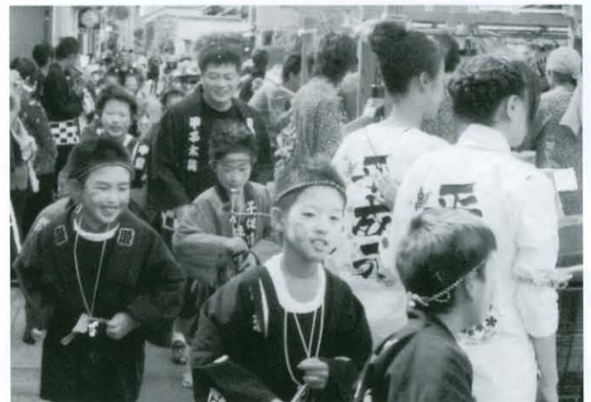
屋台のまわりを元気に走りまわる子どもたち