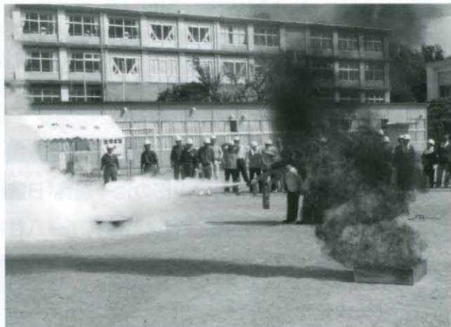
消火器の取り扱いによる初期消火訓練