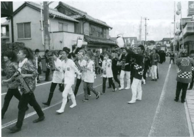
若い女性も頑張りました

10月2・3日の2日間八柱神社秋季例大祭が開催されました。 あいにく、本祭りの夕方から雨になりましたが、熱気あふれるお祭りでした。