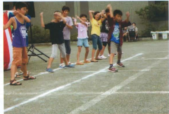
元気いっぱい！小学生による よさこいソーラン！