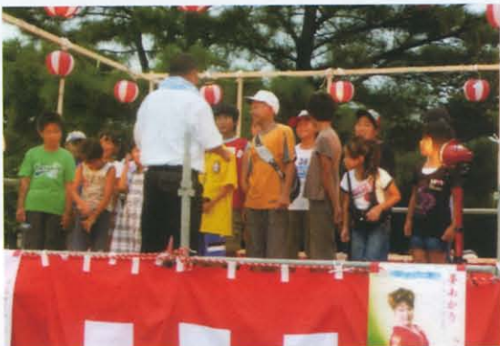
村櫛小児童と 校長先生の校歌斉唱