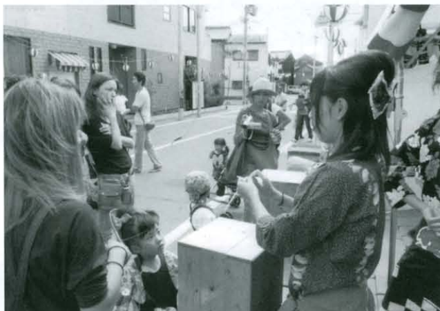
抽選会場 “当たるといいな”