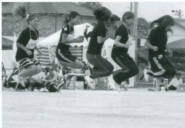
よく足が上がっています アンダー33チーム