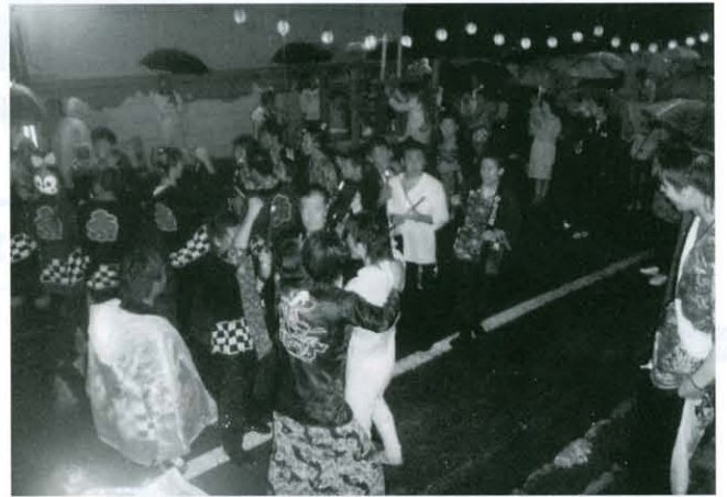
大勢で激ねりをする高校生