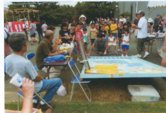
大人気のスマートボール