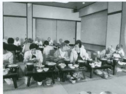
食事とカラオケなど楽しむ敬老祝寿会参加のお年寄り