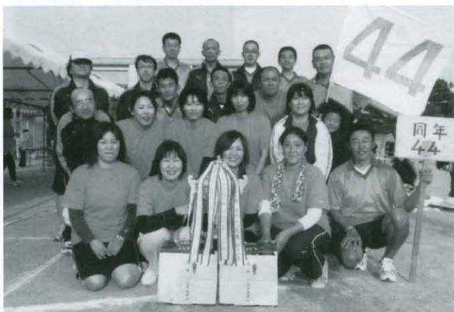
同年対抗 優勝44年チーム

10月17日第30回町民運動会が行われました。長期天気予報だと雨でしたが、最高の運動会日和に恵まれて、多くのハッスルプレーに歓声が沸きました。