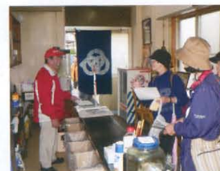
酒販売所の歴史を聞く