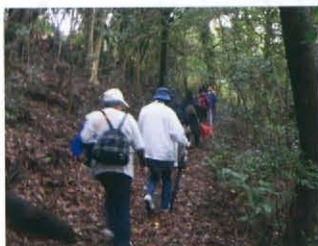
お山塚へつづく坂道