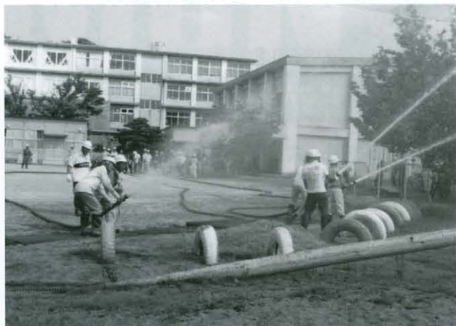
自主防災隊による目標に向けての放水訓練

9月5日(日)小学校グラウンドに180人ほどの参加者があつまり、突発地震を想定した訓練が実施されました。